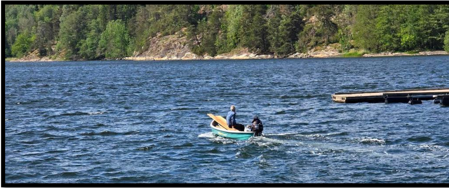
Bildet over: Gammelt nytt i Frogn; båtfrakt med tømmer og plank til England.

På Bunnefjordsiden, ca 11,5 km. ble kyststien merka og slutført for flere år siden. Dette er en ukjent perle for mange frognfolk og anbefales på det sterkeste. Rett ovenfor Nesset ligger husmannsplassen England.