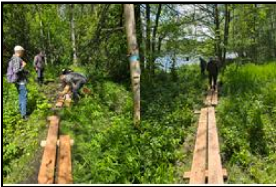
Bildet over: Dugnad med klopping ble utført våren 2025 i tide før en stor turmarsj skulle gå av stabelen.