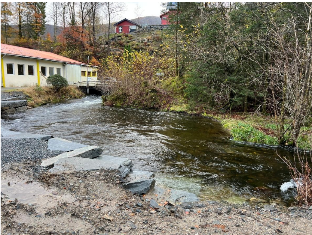
Flott nyrestaurert kulp nedstrøms tappeanlegg.