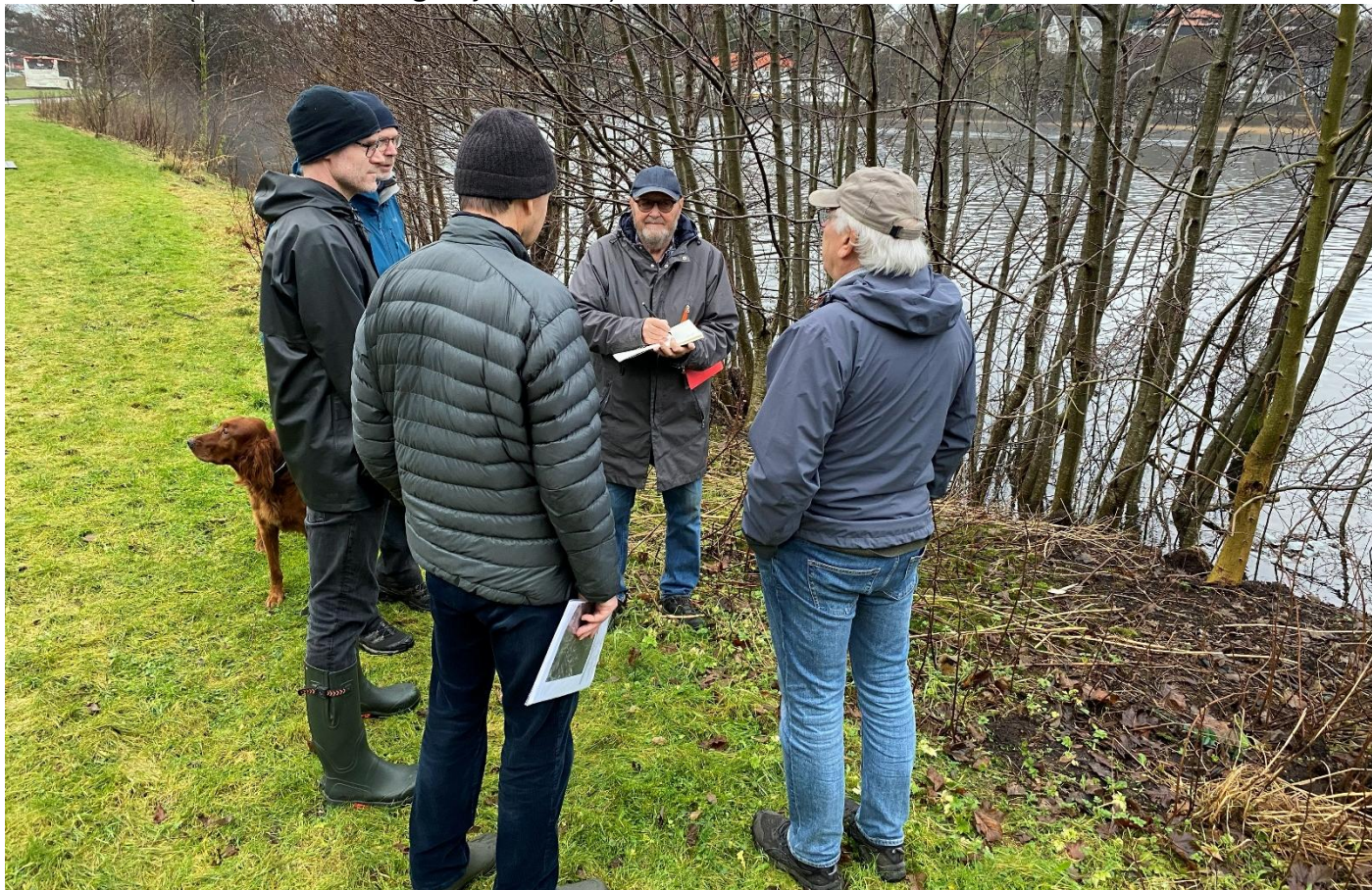
Fra befaring med vassdragsforvalter i november.

Bybanen ved Wikholm har utført arbeid med rydding av kantvegetasjon langs bybanen. Vi har ønsket å fortsette med rydding langs store og lille Nesttunvann, men har manglet nødvendig tillatelse fra grunneier som er Bergen Kommune. Det ble avholdt en befaring i desember og sendt inn ny søknad om tillatelse. (Denne ble innvilget i januar 26.)