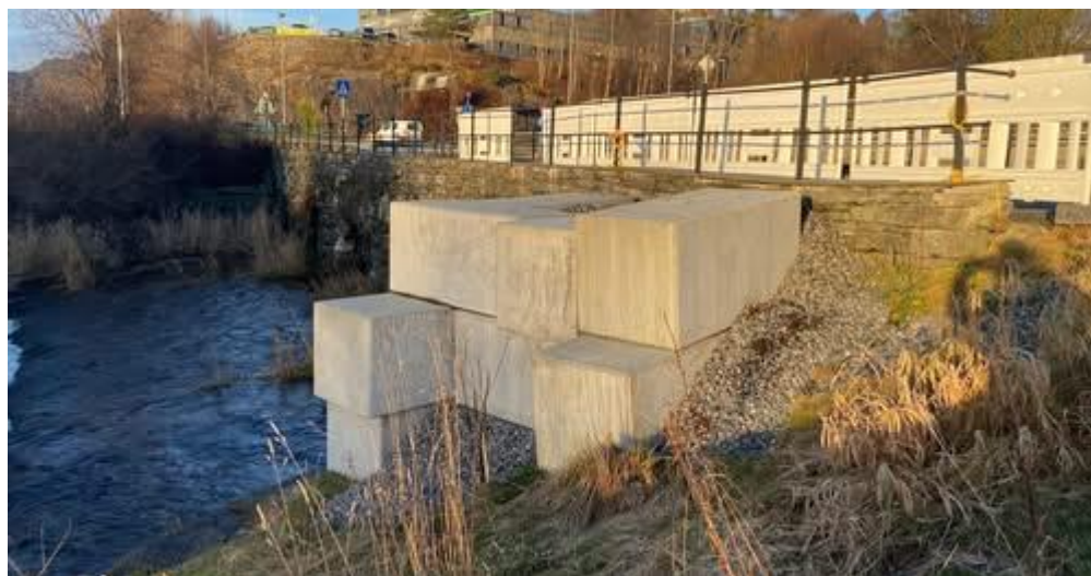
Viser hvor broen er skadet.

Styret i NVV presiserer at vi skal kun være en pådriver i dette prosjektet og at det er fylkeskommunen som må være byggherre. Infoplaketten bør vi få på plass uansett.