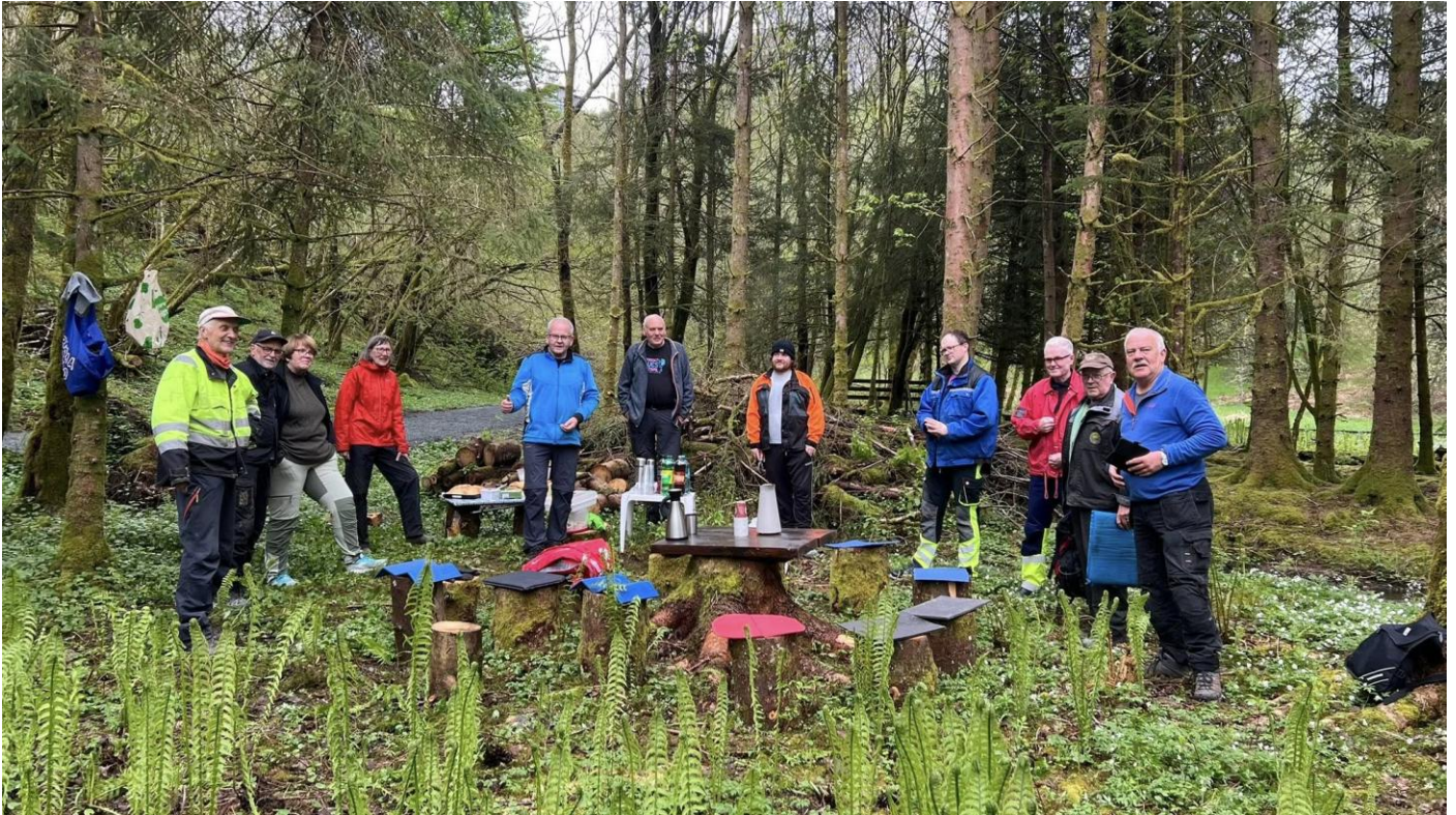
Fra dugnad ved Birkelandsvatnet. Flere av våre medlemmer bidrar også der. Gruppen har også tilbudt seg å bidra ved Store Nesttunvann.

Nesttunvassdragets venner hadde pr. 31/12-25 81 betalende medlemmer. Det ble i 2022-23 foretatt en opprydding i medlemsregisteret og alle medlemmer vi ikke hadde epost eller telefonnummer til ble lagt som utmeldt. Dette på grunn av gamle data og manglende adresser i tillegg til manglende innbetaling av kontingent i flere år.