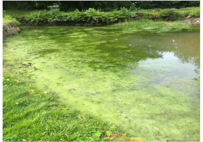
Stemmen før arbeidet startet.

Det har vært utført fjerning av slam i stemmen i løpet av sommeren. Først planlagt som slamsuging, men endret til tømning med grabb. Det ble fjernet mer enn 300m 3 med slam. Vi hadde avsatt kr.95.000,- til dette + kr.50.000,- fra Bergen Elveforum. Vi endte opp med en kostnad på kr.235.000,-. Vi fikk i ettertid også kr.50.000,- i støtte fra Fana sparebank. Det ble også sendt søknader til Norgesgruppen og Magnus & co som er grunneiere langs elven.