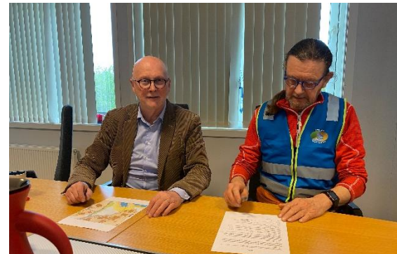
Fra signering av avtale.

Det ble samtidig gjort en stor oppgradering av elv og kulper nedstrøms tappeanlegget. Det er etter dette mulig å tappe ned elven ved fare for flom samtidig som anlegget sikrer stabil vannføring i det gamle elveløpet. Dette har i mange år vært tørrlagt i lange Perioder.