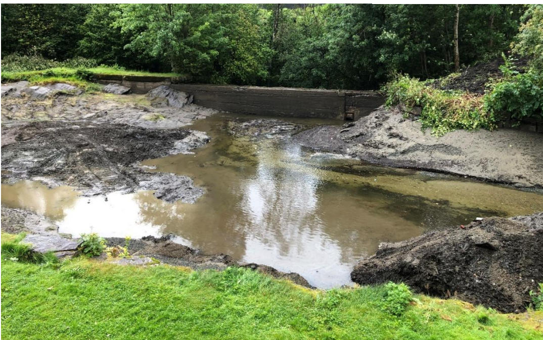
Her er det meste fjernet.