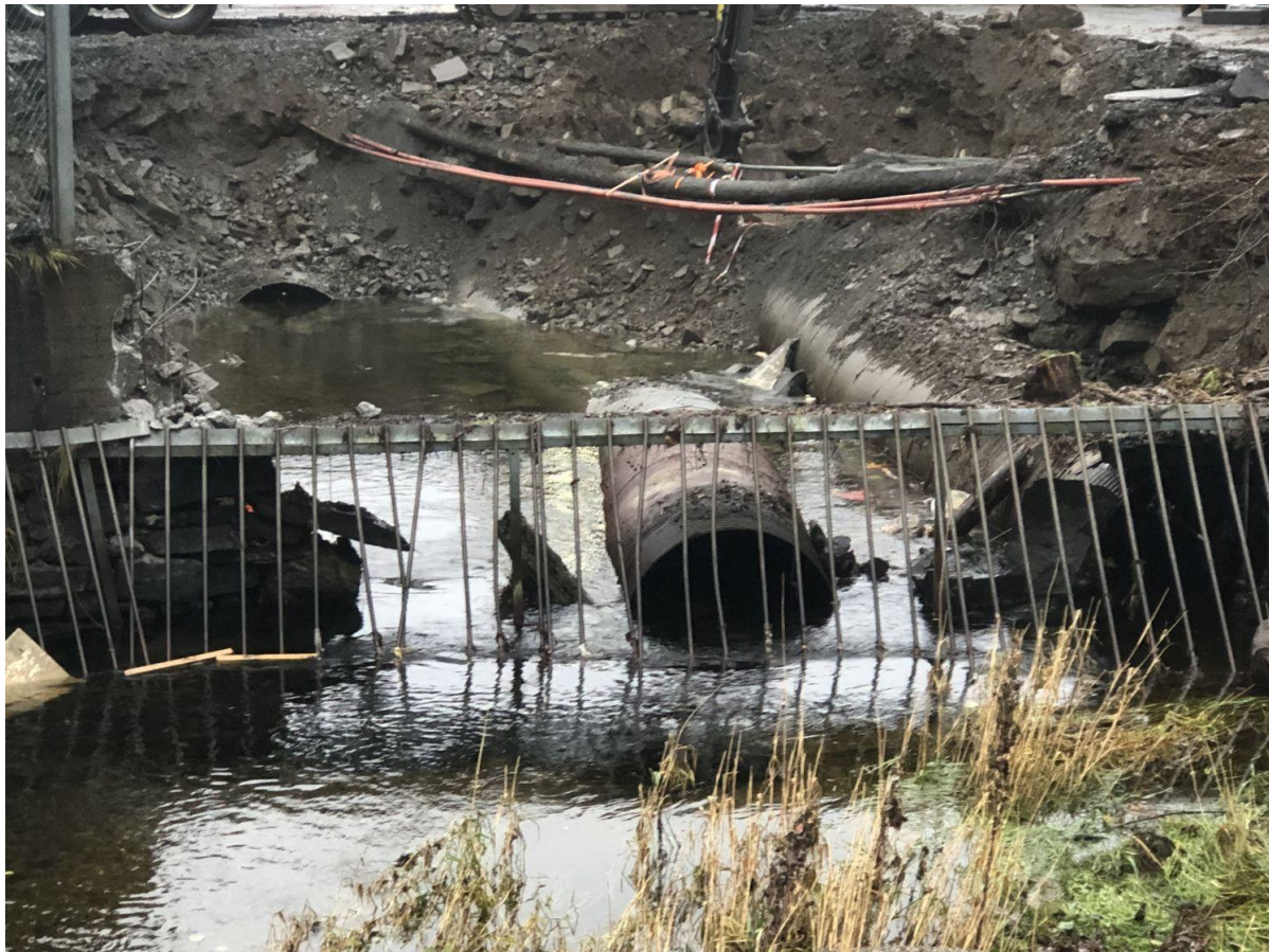
Viser de tre rørene hvor det ene er helt sammenrast.

I forbindelse med sammenbrudd i flere rør under området til Bydrift i november 2024 har vi vært på flere befaringer og gitt uttale om at alle rør må skiftes. Noen rør ble skiftet umiddelbart, men til mindre dimensjon enn de som var der. Dette må rettes og alle rørene byttes. Det er i ettertid sendt inn byggesøknad på utskifting som er tilfredsstillende.