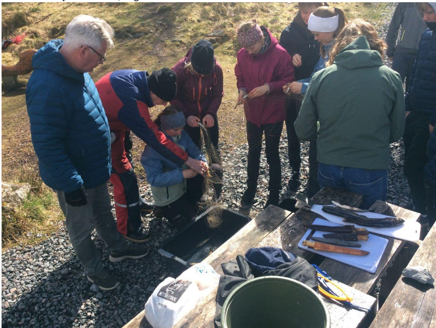
Figure 1 Elever i aksjon med garn og fisk.