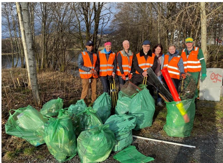
Vi får god hjelp fra Fana Sparebank til å holde det ryddig.

Det er også inngått avtale med bybanen om rydding langs banen. For dette får vi et tilskudd på kr.25.000,-.