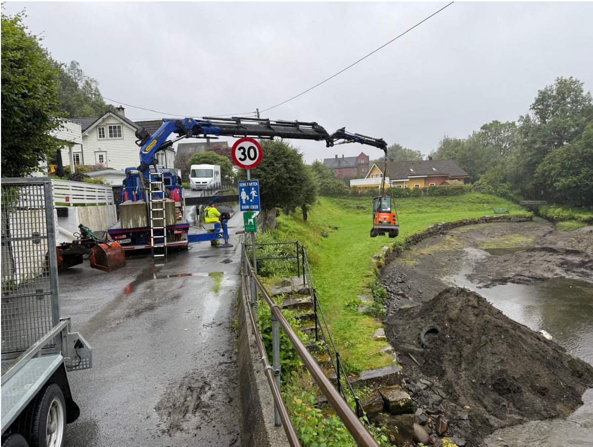
Fra arbeidet med tømning av Øvstun stemmen for slam.