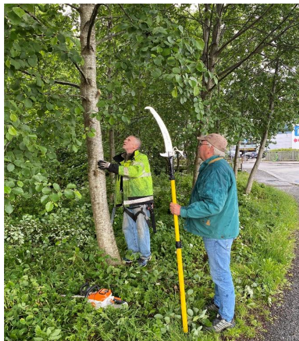
Fra rydding langs Nesttunvann.