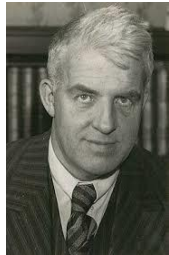
Didrik Arup Seip (1884–1963). Språkforsker, professor. Svoger til Eivind Berggrav.