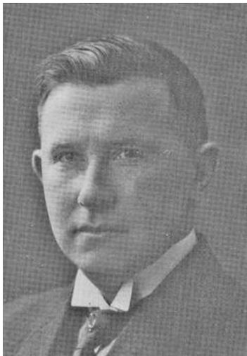
Eivind Berggrav (1884–1959). Ungdomsbilde. Biskop, kirkeleder, Romerike Historielags første formann.

Med Berggrav gikk professor Halvdan Koht, som også holdt et foredrag, som ble utgitt sammen med Berggravs. Han formet programmet slik: «Østlandsmaale maa ikkje bare lye ute paa aakeren eller innafor stuguveggen; det maa bli sett til høgbords i samfundlive og kulturarbeide. Og østlendingen sjøl maa vere kar for å gjøra det.»