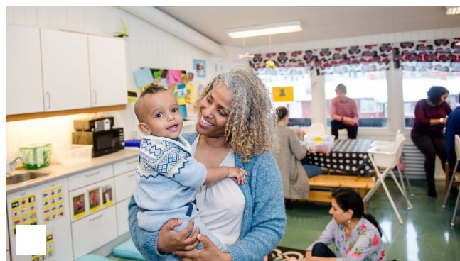
Sånn skal det gjøres!