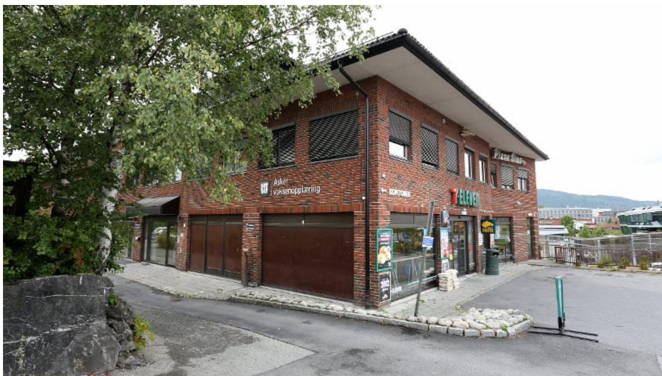
Dårligere integrering med ny organisering

for å manipulere massene endrer seg ikke.