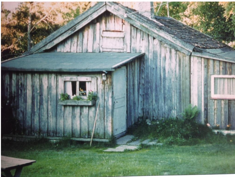
Bilde: 1 Gravdal

Vi ønsker å kommunisere bedre med deg som medlem. Send oss din email og gjerne også telefon/mobil til medlem@roa-vel.no