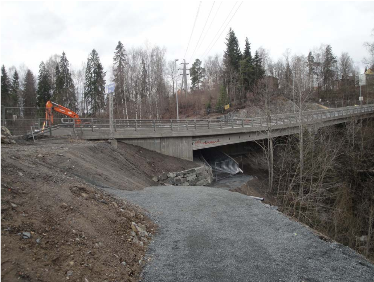
Snart ferdigstilt gangtunnel under Jarfyllinga

De flotte turveiene langs Lysakerelven har til disse dager endt brutalt i Jarfyllinga, et trist minnesmerke etter tidlige tiders miljøtankegang.