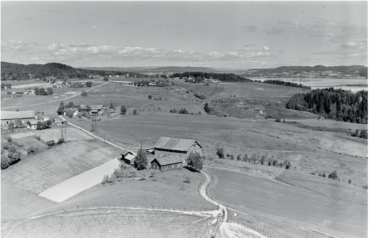
Midtre Rælingen på flyfoto fra 1949. Nersøgården Tveiter nederst mot midten. Uthusene er av nyere dato, men våningshuset på bildet er lite forandret siden avreisen i 1854. Lengst i nord, i skogholtet midt på bildet, lå husmannsplassen Nygård.