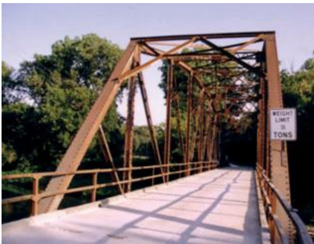
Bolson Bridge ved Upper Iowa River. Winneshiek County, Iowa.

Mot slutten av 1800-årene avtok utvandringen til Amerika fra midtbygda i Rælingen.