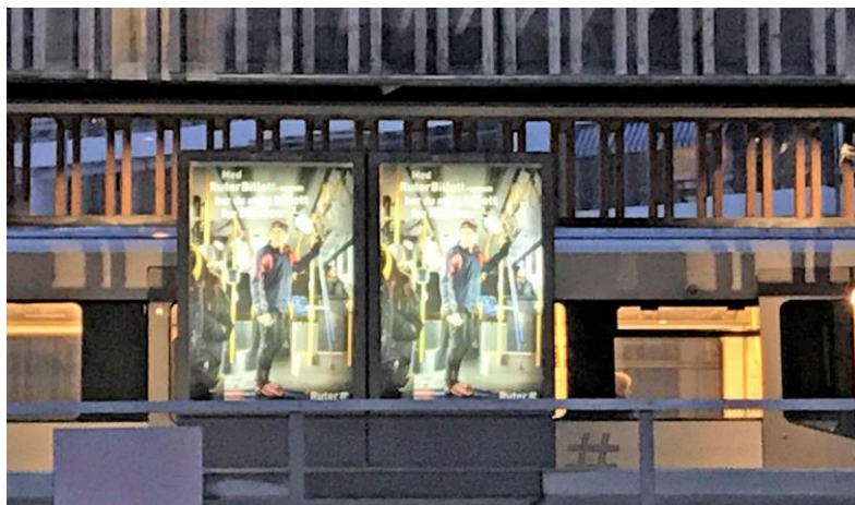
Kolsås stasjon. Fortsatt ulik pris på T-bane og buss fra Kolsås.

Det er en årlig intervjuundersøkelse, samt ulike datakilder fra selskapene, som brukes til å beregne hvordan inntektene fra billettsalget fordeles mellom NSB og Ruter. Inntektstapet ved å flytte Bærum inn i sone 1 er basert på de samme kildene (herunder eksempelvis billettsystemene). Fylkeskommunene er også blitt bedt om å starte et forprosjekt for et felles pris- og billettsystem for Viken. Forslaget om en eventuell utvidelse av sone 1 med Bærum kommune, bør derfor diskuteres og vurderes som en del av forprosjektets videre arbeidet med et felles pris- og billettsystem.»