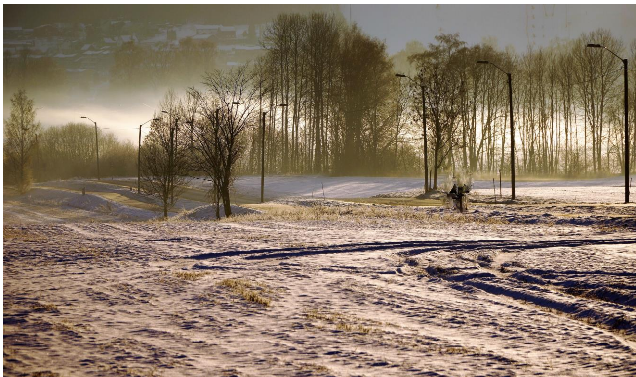
Ved Bryn.

Kostnadene ved tøy-bæreposer, som et synlig tiltak for å redusere velforeningens «miljøfotavtrykk», ble noe høyere enn budsjettert. Styret ser imidlertid på dette som et viktig miljøtiltak i velforeningen.