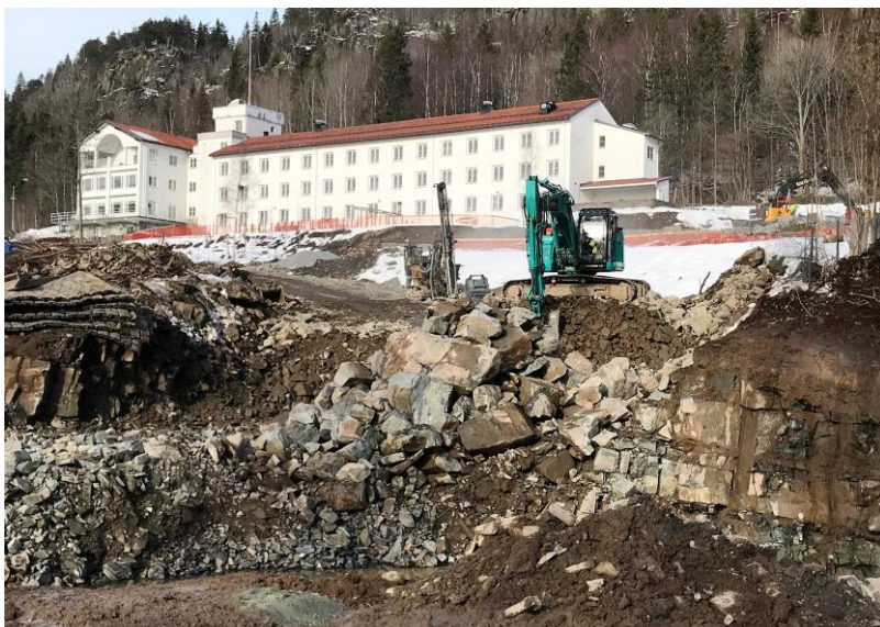
Det fjernes mye masse for å anlegge den nye tilførselsveien opp til nye leiligheter ved Fram Helseheimen..