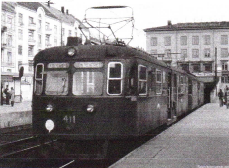
Det kan nok ta sin tid før Kolsåsbanen legges fram forbi Rykkinn.

Han pekte på at reguleringsforslaget vil føre til at banen går syd for området, og at mange vil ha lang vei til banen. Det dreier seg om 1200 til 1500 meter. Han ville heller ha banen under jorden.