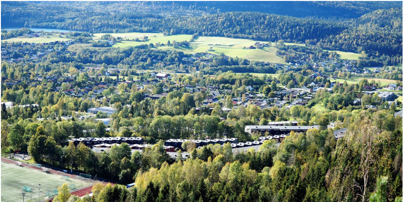
Store deler av velområdet – knapt synlig for skog og annen vegetasjon om sommeren.