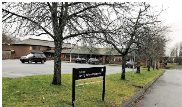
Berger bo- og behandlingssenter skal legges ned. Hva kommer i stedet?

Styret har i en henvendelse til Rykkinn skole gitt ros til elevene for innsatsen for et reinere