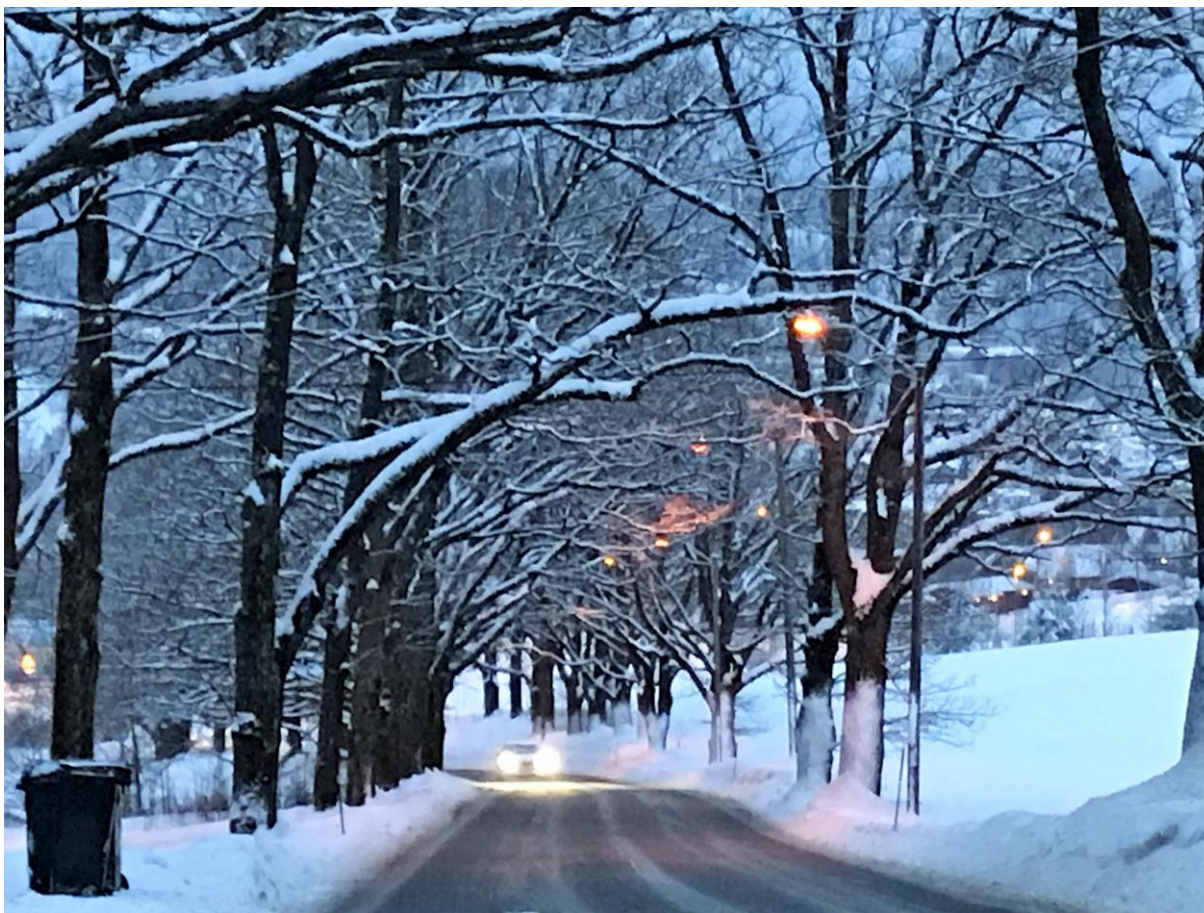
Gamle Lommedalsvei forbi Wøyen gård en vinterdag.

I planleggingen av utbyggingen på Rykkinn var det å kunne bo i samme området hele livsløpet viktig for Bærum kommune. I det lå tilbud