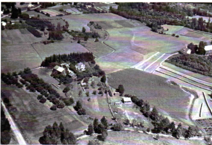
På bildet ser vi jordene rundt Saubakken, Løkka og Søndre Berger der det vil komme terrasseblokker og småhus i rekker. Rykkinnveien blir en del av ringveien.

Alle en- og tomannsboliger forutsettes oppført i en eller to etasjer med bebygd flate inntil 15% av tomtens nettoareal + garasje. Høyden fra terreng til hovedgesims må ikke overstige 6,0 m. og ingen gavlvegg må være høyere enn 8 m. Atriumshus oppføres i 1 etasje.