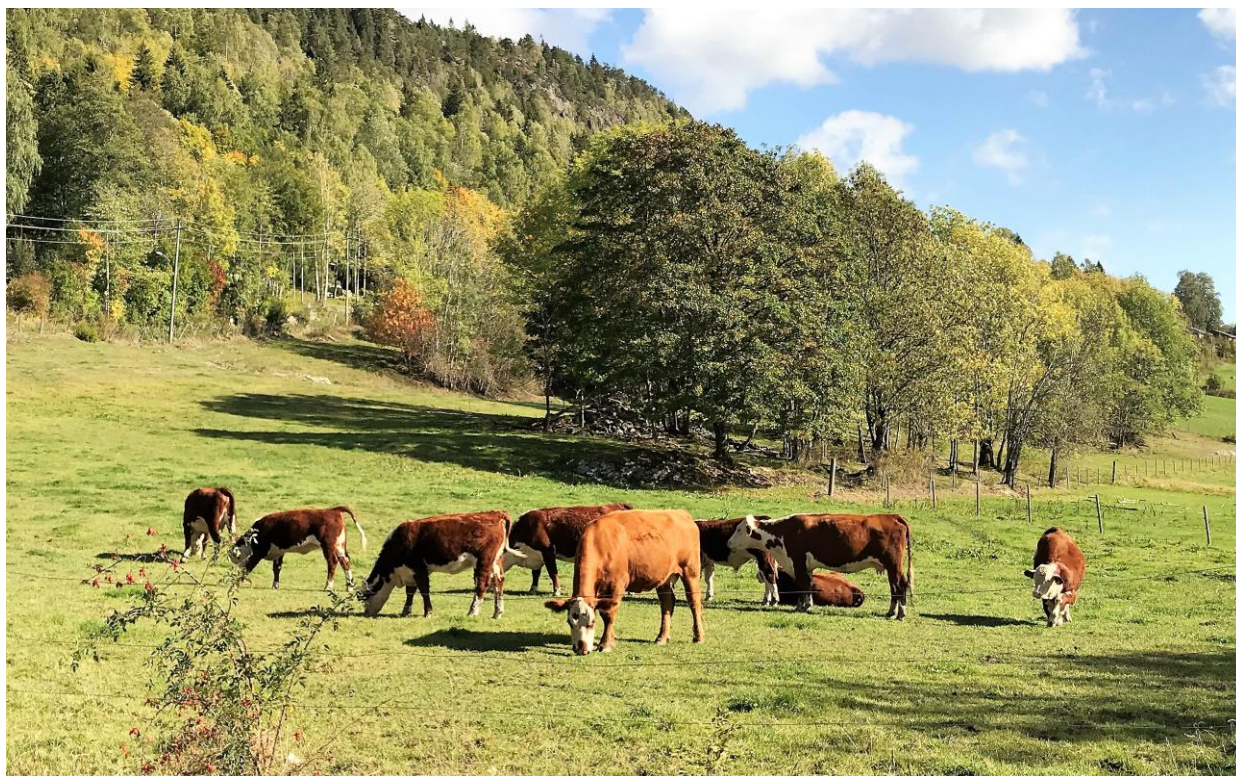
Langs Busoppveien en sensommerdag.