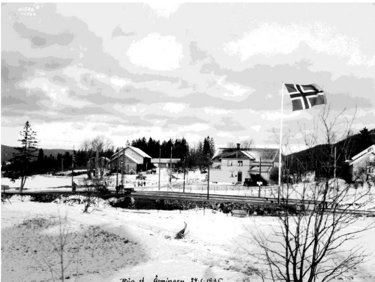
Foto 1 Åpning av Røabanen 24. jan. 1935