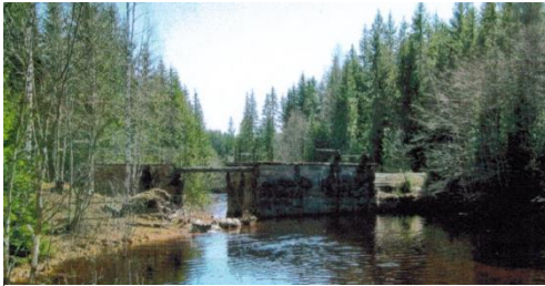
Foto 6 Sloradammen og demning i dag.

Forprosjektet fra historielaget kom ikke videre. Det ble oversendt kommunen, og ble antagelig lagt i en skuff.