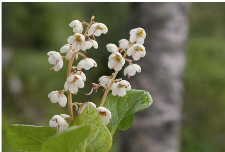
Norsk vintergrønn

Utvalget har bestått av Berit Ring og Tom Halvorsen.