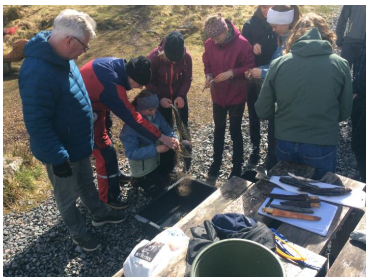
Ivrige elever fra Natland Oppvekststun i gagn med sløyging av fisk

Myrdalsvatnet har vært brukt til en rekke dager i undervisning i fiskestell og naturfag i samarbeid med Bergen Elveforum. Dette er en aktivitet vi ønsker å styrke i årene som kommer.