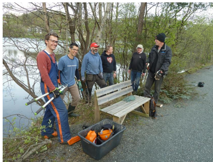
Dugnadsgjeng i gang med i skjøtsel av kantvegetasjon