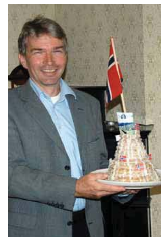
TOK KAKA: Seieren ble feiret med «tårnkak», laget av en god kollega.

– At du kan komme ganske så langt hvis du har fokus på oppgaven, ikke ser for mye ned, og har støtte fra gode kolleger.